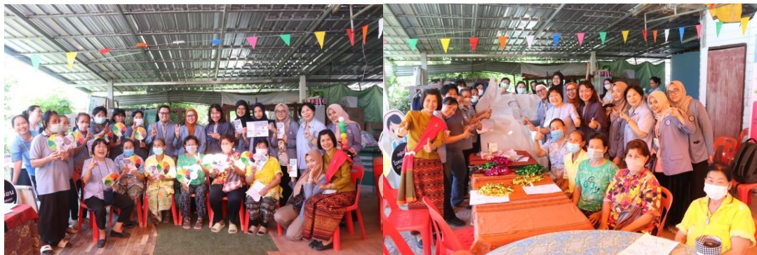
Gambar 4. Foto Bersama dengan Kader dan Dosen BCNR Thailand