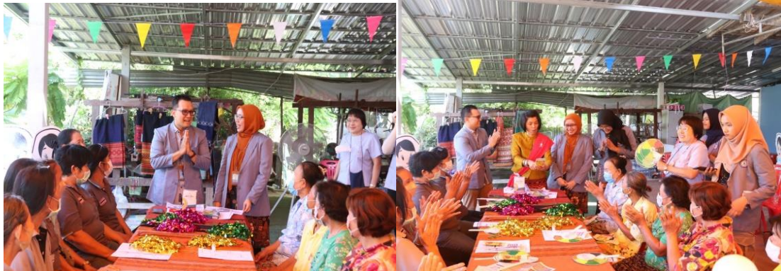
Gambar 3. Pemberian Edukasi tentang Diabetes Melitus Menggunakan Media Leaflet