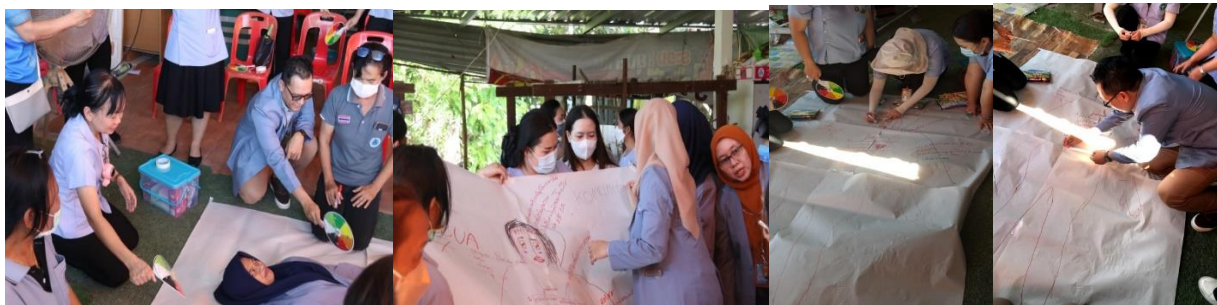
Gambar 2. Kegiatan Body Paint sebagai salah satu bentuk refleksi Bagi Kader

Pelibatan kader dalam upaya pencegahan DM di masyarakat menjadi salah satu bentuk pemberdayaan kader yang tepat dan efektif. Pendekatan dan strategi yang berbasis masyarakat merupakan salah satu rekomendasi WHO dalam menangani pasien DM. Adanya pemberian edukasi, dapat membantu meningkatkan pengetahuan dan kemampuan kader dalam melakukan pengukuran kadar glukosa darah dan pendampingan keluarga yang memiliki anggota keluarga dengan DM. Pelibatan kader sebagai change agent dan penggerak utama dalam upaya promotif dan preventif dapat dimulai dari tahap perencanaan, pelaksanaan, dan monitoring serta evaluasi. (Wahyuni & Dewi, 2024). Dengan demikian, kegiatan edukasi dapat menguatkan fungsi dan peranan kader bagi masyarakat. Selain itu, melalui aktifitas body paint kader dapat meningkatkan kapasitasnya dalam memenuhi kebutuhan masyarakat terutama dalam menyusun rencana kegiatan dan langkah-langkah yang terintegrasi guna mendukung efektifitas program yang ada.