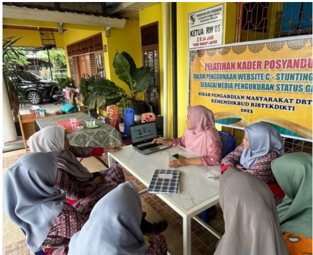
Gambar. 1. Sosialisasi C-Stunting Ke Ce Pada Kader Di Posyandu