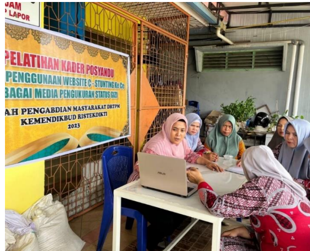
Gambar. 2. Diskusi dalam penggunaan Website C-Stunting Kece