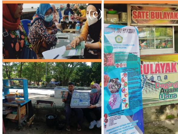
Gambar 2. Edukasi Pedagang sate bulayak di daerah wisata Pantai Ampenan, Pantai Gading dan Taman Udayana melalui (a) Booklet (b) Pemberian alat penyimpanan bahan dan bumbu sate bulayak, (c) poster higiene sanitasi

pada pelanggan baik local maupun wisatawan asing yang berkunjung ke daerah wisata pantai Ampenan, pantai Gading dan Taman Narmada, sehingga dapat memberikan kenyamanan pada wisatawan.