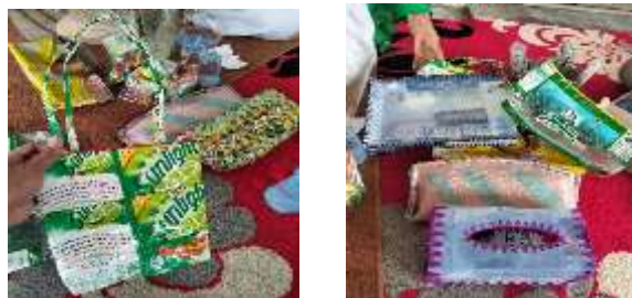
Gambar 2. Pendampingan Integrasi Bank Sampah

Gambar 2 yaitu program pemberdayaan ini diimplementasikan dengan mengintegrasikan kegiatan Posyandu Lansia dengan operasional bank sampah. Langkah awal melibatkan sosialisasi dan pelatihan kepada para lansia mengenai pentingnya pemilahan sampah dan cara kerjanya. Selanjutnya, lansia dilibatkan secara langsung dalam pengelolaan bank sampah, mulai dari mengumpulkan, memilah, hingga menimbang sampah anorganik. Hasil penjualan sampah tersebut kemudian dibukukan sebagai tabungan atau diberikan dalam bentuk insentif bagi lansia, yang secara signifikan meningkatkan kemandirian finansial mereka. Pelaksanaan program menunjukkan hasil yang menjanjikan. Peningkatan partisipasi lansia dalam kegiatan posyandu terlihat jelas, di mana insentif ekonomi dari bank sampah menjadi faktor pendorong