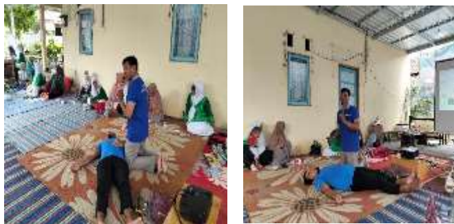
Gambar 4. Pelatihan Bantuan Hidup Dasar (BHD)

Gambar 4. menunjukkan bahwa kelompok sasaran utama pelatihan Bantuan Hidup Dasar (BHD) terdiri dari kader kesehatan, tenaga relawan, dan masyarakat umum yang berada di wilayah binaan. Pemilihan kelompok ini dilakukan secara strategis untuk memastikan bahwa pengetahuan dan keterampilan BHD dapat tersebar secara luas di masyarakat. Melalui indikator peningkatan keterampilan resusitasi jantung paru (RJP) dan penanganan henti napas secara cepat dan tepat, program ini berhasil mencapai target partisipasi dan kelulusan 100%. Menurut hasil evaluasi, peserta menyatakan bahwa materi pelatihan mudah dipahami, relevan dengan situasi