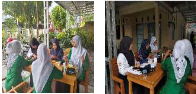
Gambar 5. Skrining Penyakit Tidak Menular

Gambar 5. menunjukkan bahwa sasaran utama kegiatan skrining penyakit tidak menular (PTM) terdiri dari masyarakat usia produktif hingga lanjut usia, yang menjadi kelompok berisiko tinggi terhadap hipertensi, diabetes melitus, hiperurisemia, dan hiperkolesterolemia. Kegiatan ini dilakukan secara sistematis dengan menggunakan indikator cakupan pemeriksaan dan temuan kasus baru sebagai tolok ukur keberhasilan. Berdasarkan hasil pelaksanaan, program berhasil mencapai target partisipasi masyarakat 100%, dengan sebagian peserta teridentifikasi memiliki hasil pemeriksaan di atas batas normal dan diarahkan untuk mendapatkan tindak lanjut ke fasilitas kesehatan.