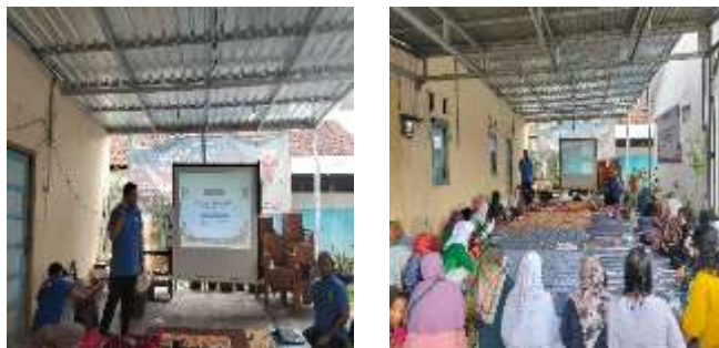
Gambar 3. Penyuluhan Penyakit Tidak Menular (PTM)