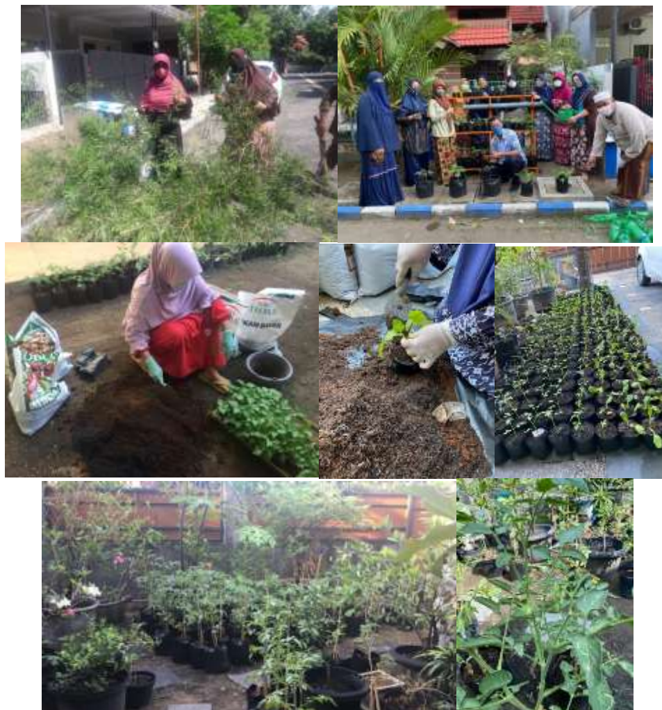
Gambar 1. Dokumen kegiatan mulai dari penyiapan lahan, pencampuran media, transplanting, perawatan tanaman

Sistem Tanam hidroponik juga disiapkan sebagai altematif tanam yaitu bisa menggunakan media non tanah: pasir, air dan substrat baik. Sistem Air dan substrat yang paling sederhana karena menggunakan ruangan kecil. Sistem kultur. Dalam kegiatan ini kami fokuskan pada Hidroponik wick. Namun karena terkendala cuaca dan butuh tempat yang sesuai, namun keggiatan ini kurang berhasil.