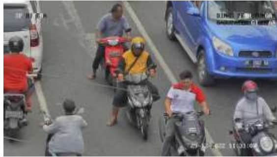
Gambar 3. Pengendara Tidak Menggunakan Masker