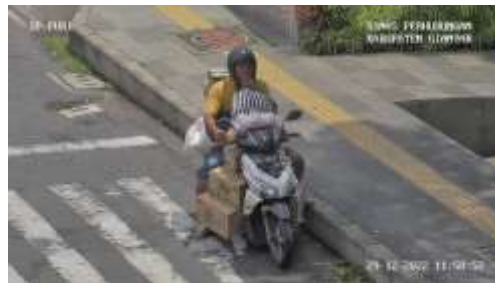
Gambar 1. Pengendara Parkir Sembarangan

Tabel tersebut dapat diketahui bahwa pelanggaran lebih sering dilakukan oleh pengendara sepeda motor, dan untuk pengendara mobil atau angkutan umum tidak terpantau adanya pelanggaran selama pelaksanaan mikro magang. Untuk pelanggaran sepeda motor kami sajikan kembali dengan grafik di bawah.