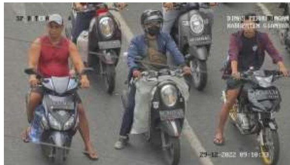
Gambar 1. Pengendara yang tidak menggunakan helm

Tabel 1 dapat dilihat banyaknya pelanggaran yang dilakukan oleh pengendara sepeda motor adalah tidak menggunakan helm. Jumlah pelanggar tertinggi terjadi pada tanggal 27 Desember 2022 yaitu sejumlah 48 pengendara sepeda motor yang tidak menggunakan helm. Kemudian untuk pengendara sepeda motor yang melewati titik stopline tertinggi terjadi pada tanggal 27 dengan jumlah 6 sepeda motor. Sementara jika dilihat dari pelanggaran melewati titik stop line untuk mobil, terjadi pada tanggal 3 yaitu 3 mobil. Untuk angkutan sejauh ini yang terdapat pada tabel belum terdapat pelanggaran yang terpantau oleh ATCS Dishub Gianyar.