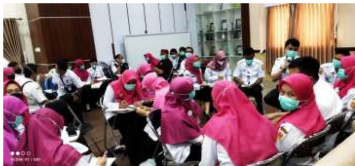
Gambar 6 Proses Diskusi Penyusunan PAK

Kegiatan penyusunan PAK dilanjutkan oleh seluruh peserta workshop sebagai tim penyusun yang telah dibentuk dan ditetapkan berdasarkan SK Direktur. Dengan disusunnya PAK ini diharapkan rumah sakit memiliki acuan yang terstandar sesuai dengan perundang-undangan yang berlaku. Panduan Asuhan Keperawatan yang telah disusun nantinya akan menjadi satu pedoman yang akan digunakan oleh seluruh perawat di rumah sakit dalam menetapkan rencana asuhan keperawatan kepada pasien (Ari S, V., Rahman, L., & Nur. Y, 2022).