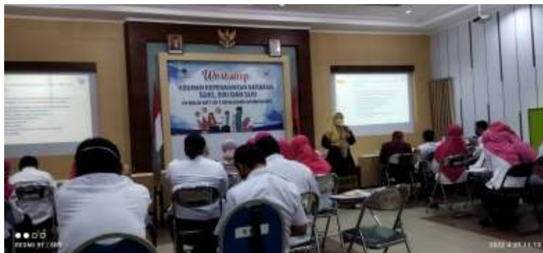
Gambar-2 Pemaparan Materi