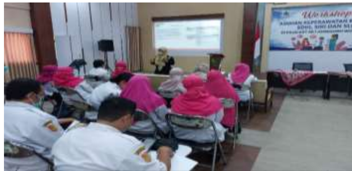
Gambar-1 Pemaparan Materi Workshop

Pemaparan materi dilaksanakan dengan menggunakan LCD, laptop dan power point. Materi yang disampaikan meliputi Konsep Proses Keperawatan, Aspek Legal Standar Asuhan Keperawatan berbasis SDKI, SLKI dan SIKI. Menurut UU No. 36 Tahun 2014 tentang tenaga kesehatan Pasal 66 ayat 1 menyebutkan bahwa setiap tenaga kesehatan dalam menjalankan praktik berkewajiban untuk mematuhi standar profesi, standar pelayanan profesi dan standar prosedur operasional. SDKI, SLKI dan SIKI ini merupakan standar profesi keperawatan dalam melakukan asuhan keperawatan yang telah ditetapkan oleh PPNI sebagai organisasi resmi profesi perawat. Setiap perawat berkewajiban untuk memahami konsep 3S ini dengan baik, sehingga perawat dapat mengaplikasikannya saat melakukan asuhan keperawatan.