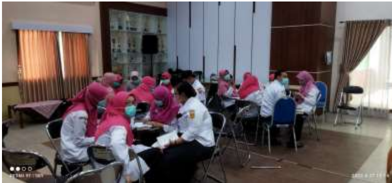
Gambar 5 Proses Diskusi Penyusunan PAK

Setelah pemaparan materi selesai, dilanjutkan dengan proses diskusi. Diskusi dilakukan di tempat pelaksanaan workshop dengan cara membagi peserta menjadi 7 kelompok kecil untuk menyusun draft panduan asuhan keperawatan. Kegiatan diskusi juga difasilitasi oleh dosen narasumber, kepala bidang keperawatan dan tim. Penyusunan panduan asuhan keperawatan akan membantu perawat dalam melakukan pemberian asuhan keperawatan secara terintegrasi dan selanjutnya akan didokumentasikan ke dalam catatan perkembangan pasien terintegrasi atau yang dikenal dengan istilah CPPT. Pendokumentasian pada CPPT membutuhkan kolaborasi antar profesi sebagai bentuk Inter Professional Collaboration (IPC) sekaligus untuk meminimalkan adanya pengulangan / duplikasi dan kesalahan klinis serta untuk meningkatkan kualitas pelayanan Kesehatan kolaboratif karena melibatkan berbagai disiplin ilmu (Dahlke et al., 2020). Selain itu menurut Simanjuntak (2019) untuk melaksanakan kolaborasi antar profesi di bidang kesehatan sangat diperlukan adanya komunikasi efektif sehingga tujuan utama pelayanan kesehatan yang mengutamakan keselamatan pasien dapat tercapai.