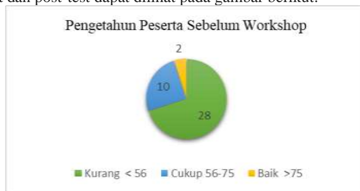
Gambar 1 Pengetahuan Peserta Sebelum Workshop

Hasil pre-test dan post-test dapat dilihat pada gambar berikut: