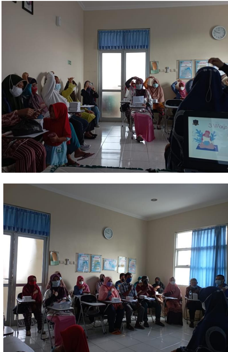
Gambar 2. Foto Latihan Strategi Koping dengan Metode SEFT

meningkatkan kemampuan mengelola emosi. Selain itu juga peningkatan aspek kemampuan penerapan pola mekanisme koping dengan metode SEFT melalui lembar observasi. Pemilihan metode SEFT ini dikarenakan tindakan ini dilakukan untuk menggabungkan energy spiritual dan metode tapping sehingga meningkatkan proses katasis pada pasien. Proses ini yang menjadikan pasien lebih rileks dan tenang (Adhistry et al., 2019). Berikut ini merupakan dokumentasi kegiatan latihan strategi koping yang berfokus pada emosi dengan metode SEFT, dimana kegiatan ini meliputi psikoedukasi dan praktikum: