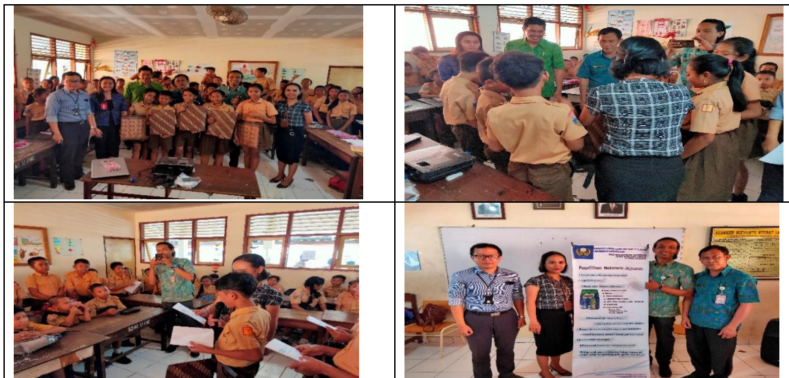
Gambar 4 Pemilihan kader siswa konsumen cerdas

Pemberian informasi cara-cara pemilihan makanan jajanan yang perlu ditekankan kepada kader siswa dalam menjelaskan ke teman-temannya di lingkungan Sekolah Dasar Negeri 10 Denpasar