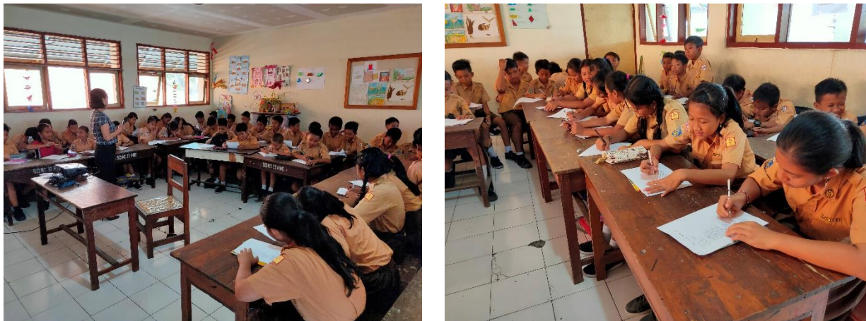
Gambar 2. Pelaksanaan Pretest dan Post test

juga dapat mempengaruhi pola konsumsi makanan jajanan sehingga siswa dapat memilih makanan jajanan yang sehat (Vera T Harikedua, Nonce N. Legi, 2015; Yunita Syafitri, Hidayat Syarief, 2009). Sebelum pelaksanaan pengabdian tim PKM melakukan pretest dan posttest untuk mengetahui sejauh mana pengetahuan siswa Sekolah Dasar mengenai Pemilihan Makanan Jajanan di Sekolah Dasar Negeri 10 Denpasar. Pelaksanaan kegiatan ini diikuti 38 siswa beserta 3 guru sekolah yang mendampingi. Dari 38 siswa dipilih 5 kader siswa sekolah yang dipilih dari pihak sekolah. Usia siswa sekolah sebagian besar berusia 11 tahun, 18 berjenis kelamin perempuan dan 20 berjenis kelamin laki-laki.