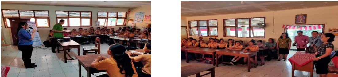
Gambar 3. pemberian materi siswa konsumen cerdas

dan lemak yang tidak baik bagi kesehatan. Makanan yang banyak mengandung garam, gula dan tinggi lemak dapat menimbulkan penyakit kronis tidak menular seperti diabetes mellitus, tekanan darah tinggi dan penyakit jantung. Oleh karena itu, mengonsumsi makanan cepat saji atau makanan jajanan harus sangat dibatasi, dengan menjaga konsumsi makanan jajanan berarti juga menjaga status gizi dalam keadaan normal. Dengan makanan jajanan yang sehat dapat memberikan manfaat yang sangat besar pada saat menjalani proses pembelajaran maupun status gizi anak tersebut. (Alif, 2020; Nurul, 2017)