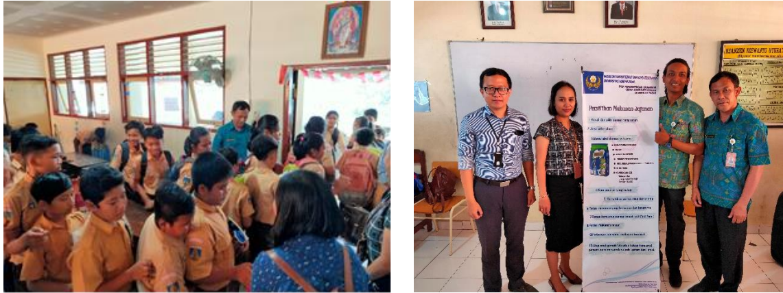
Gambar 5 Penyerahan makanan sehat dan foto bersama wali kelas Sekolah Dasar Negeri 10 Denpasar

Seluruh siswa mendapatkan bingkisan makanan sehat sekaligus sebagai contoh untuk mempraktekkan langsung cara memilih makanan jajanan yang sehat untuk anak sekolah. Kader siswa mendapatkan reward bagi yang telah melaksanakan tugas mereka memberi pengetahuan ke siswa lainnya menggunakan pamphlet.