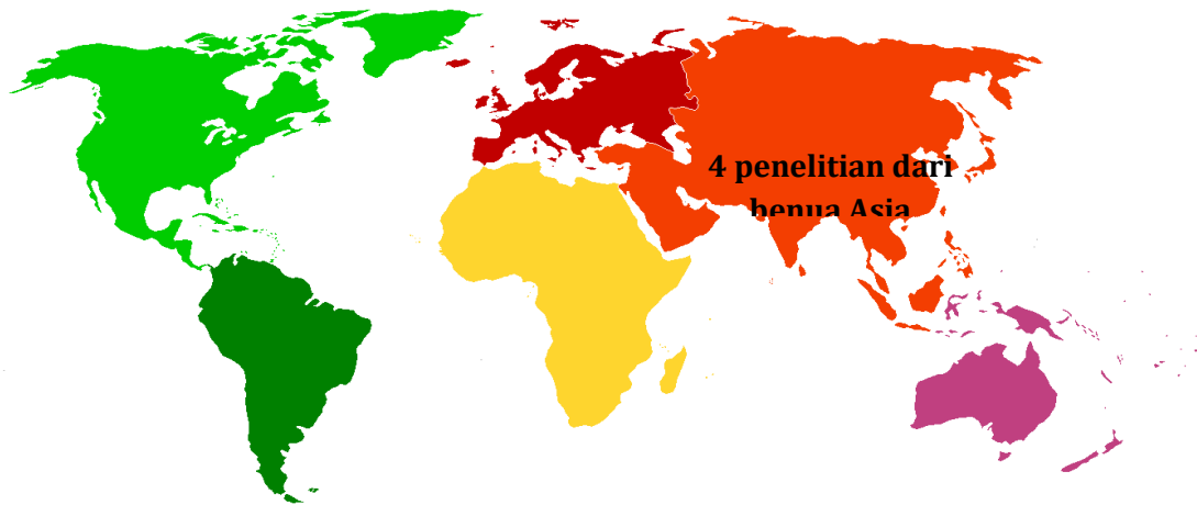
Gambar 2. Peta wilayah penelitian

Pencarian artikel dalam penelitian ini melalui database yang meliputi Google Scholar. Dengan kata kunci antara lain: " Pasien " AND "Okupasi terapi berkebun AND "Penurunan harga diri rendah". Proses review artikel terkait dapat dilihat dalam PRISMA flow diagram pada Gambar 1. Penelitian terkait terapi okupasi terapi berkebun dengan penurunan harga diri rendah terdiri dari 5 artikel dari proses pencarian awal memberikan hasil 219 artikel, setelah proses penghapusan artikel yang terpublikasi didapatkan 66 artikel dengan 74 diantaranya memenuhi syarat untuk selanjutnya dilakukan review full text sebanyak 5 artikel. Dapat dilihat pada Gambar 2 bahwa artikel penelitian yang berasal dari 4 dari benua Asia (Indonesia).