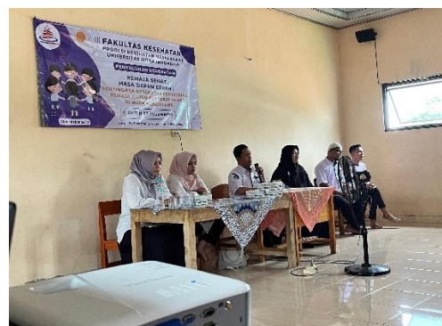
Gambar 3. Pembukaan Kegiatan