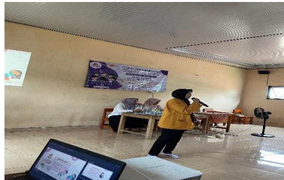
Gambar 5. Penyampaian Materi Penyuluhan