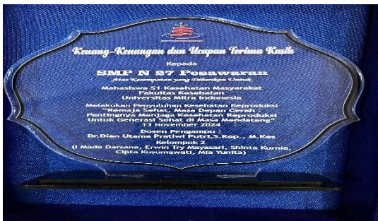
Gambar 8. Pemberian Plakat