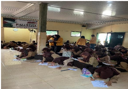
Gambar 4. Pengerjaan Pre-test