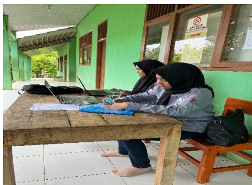
Gambar 2. Persiapan Penyuluhan

Hasil analisis pre-test dan post-test menunjukkan peningkatan signifikan dalam pengetahuan peserta mengenai kesehatan reproduksi remaja. Nilai rata-rata pre-test sebesar 8,48 meningkat menjadi 9,48 pada post-test, dengan rata-rata peningkatan sebesar 1 poin. Sebagian besar peserta menunjukkan perbaikan skor, khususnya pada peserta dengan nilai awal yang lebih rendah. Peningkatan ini mencerminkan efektivitas metode penyuluhan yang digunakan, yaitu kombinasi ceramah, diskusi interaktif, serta penggunaan media leaflet dan visual. Materi yang disampaikan mencakup aspek-aspek penting seperti pengertian kesehatan reproduksi, perubahan pubertas, kebersihan organ reproduksi, serta risiko perilaku seksual dan pencegahan penyakit menular seksual. Dengan demikian, kegiatan ini berhasil meningkatkan pengetahuan siswa secara keseluruhan dan berpotensi membentuk sikap serta perilaku yang lebih sehat dan bertanggung jawab terhadap kesehatan reproduksi.