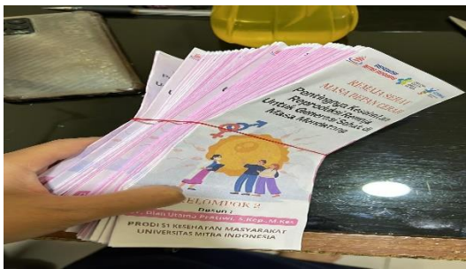
Gambar 6. Pembagian Leaflet