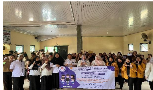
Gambar 9. Dokumentasi bersama