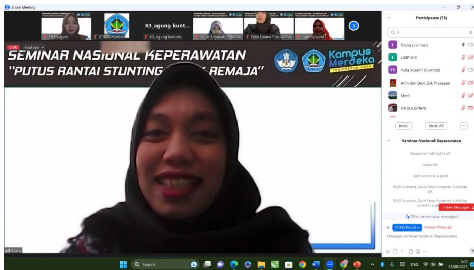
Gambar 2. Penyampaian materi Remaja Tangguh dan Sehat Jiwa