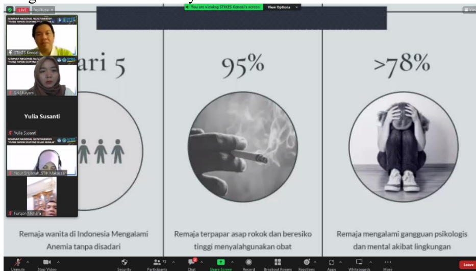
Gambar 1. Penyampaian materi Remaja Beresiko Kasus Stunting

Hasil dari kegiatan pengabdian masyarakat ini dapat dilihat dari antusias dan keinginan peserta terlihat dalam mengikuti kegiatan ini sampai dengan selesai dan adanya pertanyaan yang diajukan peserta kepada pemateri saat sesi tanya jawab berlangsung. Adapun dibawah ini dokumentasi dalam proses kegiatan seminar diantaranya: