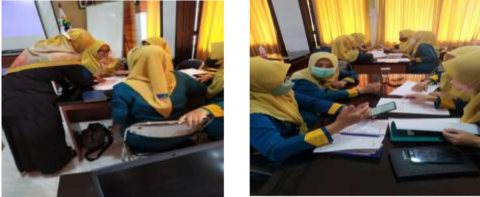
Gambar 2 Kegiatan Pendampingan dan Diskusi

Pendidikan keperawatan ditatanan klinik tidak terlepas dari proses preceptorship sehingga terwujud generasi perawat yang professional. (Putriyanti, Pamenang, & Suwarsono, 2019) Pelatihan adalah pengalaman belajar yang dirancang untuk membantu peserta pelatihan menguasai keterampilan yang belum dimiliki. Program pelatihan yang dilakukan untuk meningkatkan pengetahuan, keterampilan dan sikap sehingga pelaksanaan pelatihan harus mampu meningkatkan kemampuan secara kognitif yang dilakukan dengan menggunakan metode ceramah dan diskusi serta role play untuk meningkatkan keterampilan peserta pelatihan. (Lestari, et al., 2021).