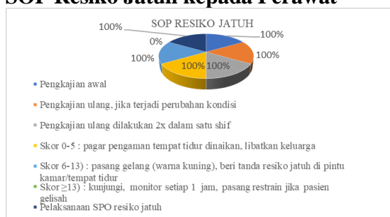
Gambar 3. Hasil observasi perawat tentang penerapan resiko jatuh di Ruang Asoka RSUD Prof Dr. Margono Soekarjo Purwokerto pada bulan Oktober-Desember.

Gambar 3 menunjukkan 10 perawat telah menerapkan SOP resiko jatuh dengan kategori baik (85%)) meliputi pengkajian awal resiko jatuh, pengkajian ulang jika terjadi perubahan kondisi pasien dan pengkajian dilakukan 2 kali dalam satu shift.