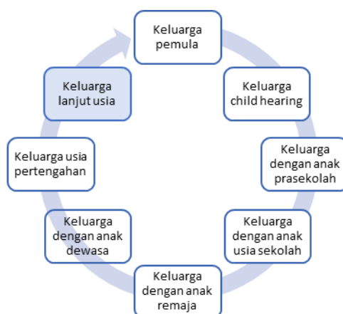
Gambar 1. Siklus Keluarga Ny.R