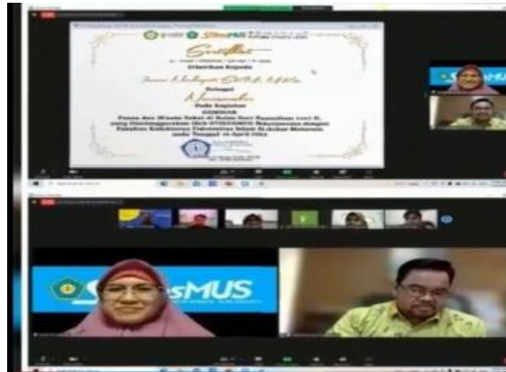
Gambar 5. Penyerahan sertifikat pembicara