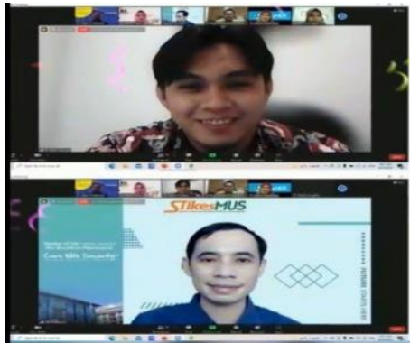
Gambar 2. Kolaborasi UNIZAR dan STIKESMUS