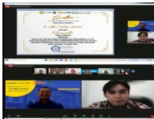
Gambar 4. Penyerahan sertifikat pembicara 2