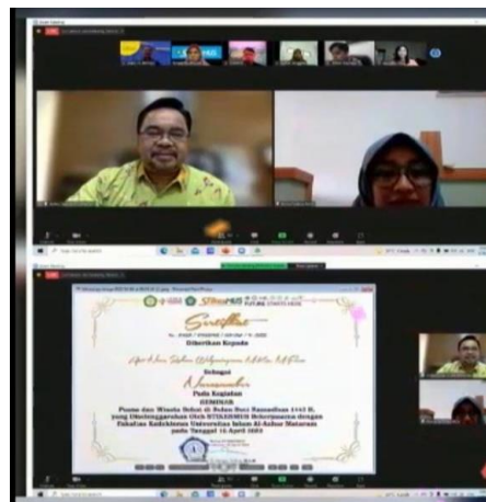
Gambar 3. Penyerahan sertifikat pembicara 1