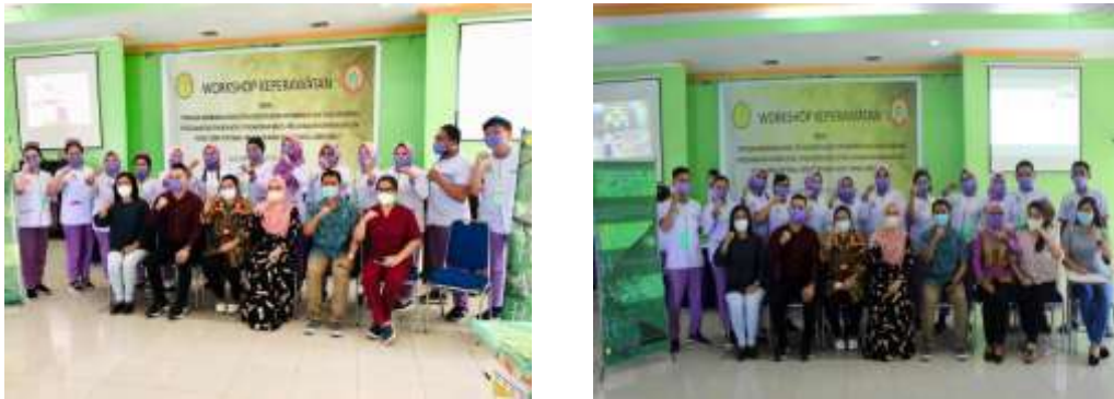
Gambar 2. Saat Selesai Pelaksanaan Acara Workshop dengan Ketua Tim Dan Kepala Ruang RS TK II Robert Wolter Mongisidi Manado

Hasil yang dapat kita temukan setelah mengetahui bagaimana pentingnya standar asuhan keperawatan maka kita akan semakin paham mengenai sebuah proses asuhan keperawatan yang sesuai dengan standar yang sudah di buat, dan juga di harapkan perawat semakin meningkatkan proses asuhan keperawatan agar lebih baik lagi baik dari segi pengkajian, diagnosa keperawatan, intervensi, implementasi dan evaluasi. Karena dengan demikian tercapai jugalah proses asuhan keperawatan terhadap setiap pasien yang sedang perawat tangani secara komprehensif dan juga akan mempermudah perawat dalam mengambil sebuah keputusan dalam melakukan sebuah tindakan di dalam proses keperawatan itu sendiri, Sehingga dapat menghindarkan perawat dari kesalahan pada saat pemberian asuhan keperawatan pada setiap pasien.