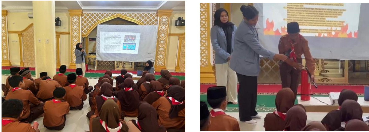
Gambar 1. Pemaparan Materi dan Simulasi Penggunaan APAR

kebakaran dan demonstrasi menggunakan APAR didapatkan hasil 97% siswa memahami dengan baik tentang materi yang diedukasikan (Suhelmidawati et al., 2024). Hal ini sejalan dengan penelitian yang dilakukan oleh Nuraida et al (2024), setelah dilakukan edukasi mengenai gambaran kesiapan peserta menghadapi kebakaran, mayoritas santri pesantren Bina Insani mempunyai tingkat kesiapsiagaan kategori siap. Kesiapsiagaan para santri ini menjadi hal penting guna mengurangi resiko dan potensi korban jiwa, dan cepat memberikan informasi serta mengarahkan santri lainnya agar cepat, tepat dan tenang dalam menghadapi kebakaran (Nuraida & Prajayanti, 2024). Hasil penelitian yang dilakukan oleh Diba et al (2024) dinyatakan bahwa setelah diberikan edukasi mengenai pencegahan dan penanggulangan kebakaran pada 31 peserta siswa SMPN 6 Desa Belaban Ella, didapatkan terjadi peningkatan pengetahuan siswa mengenai bencana kebakaran. Hal ini diperoleh melalui hasil kuesioner pre test 54% kemudian post test meningkat menjadi 94% (Diba et al., 2024).