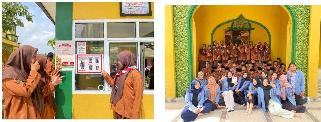
Gambar 2. Pemasangan Poster Penggunaan APAR dan Foto Bersama Peserta Kegiatan