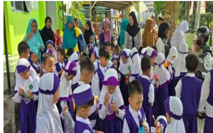
Gambar 4. Kegiatan pengabdian masyarakat di RA Nurul Huda

Kegiatan pengabdian masyarakat berada pada area kebijakan manajemen pelayanan kesehatan yaitu siswa dari RA Nurul Huda Kediri. Sebanyak 70 siswa mendapatkan edukasi terkait cara menyikat gigi dan mulut yang benar.