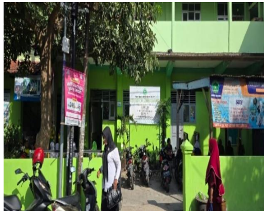
Gambar 1. Lokasi Pengabdian Masyarakat

Lokasi Kegiatan pengabdian masyarakat dilakukan di salah satu sekolah satuan pendidikan anak usia dini yang berada di Kediri. Sekolah tersebut bernama RA Nurul Huda Kediri yang berlokasi di Boro, Jl. Pajajaran Nomor 02, Pojok, Kec. Mojoroto, Kota Kediri, Jawa Timur 64115. RA Nurul Huda Kediri merupakan lembaga pendidikan anak usia dini swasta yang memiliki gambaran umum berlokasi strategis berada di tengah kota. Sekolah pendidikan anak usia dini RA Nurul Huda Kediri memiliki beberapa kelengkapan yang menunjang dalam proses belajar