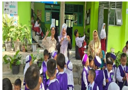
Gambar 5. Kegiatan menyikat gigi di RA Nurul Huda Kediri

Siswa nantinya akan diajarkan cara menyikat gigi yang benar oleh dokter gigi dari Universitas Kadiri. Selain itu, untuk kelancaran proses kegiatan cara menyikat gigi yang benar dan cara menjaga kesehatan gigi dan mulut guru serta tendik RA Nurul Huda Kediri akan dilibatkan langsung dalam kegiatan. Kegiatan edukasi kesehatan pada siswa di RA Nurul Huda Kediri berfokus pada cara menggosok gigi yang benar sebab anak harus diajarkan cara menyikat gigi yang menjadi langkah awal untuk menghindari resiko karies gigi. Harapannya dari edukasi mengenai cara menyikat gigi yang benar dapat menjadi perubahan perilaku sehat bagi anak – anak hingga dewasa.