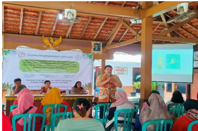
Gambar 1. Pemaparan Materi

kebiasaan kolektif masyarakat tani. Apabila dukungan ini dapat terjalin secara konsisten, maka tujuan jangka menengah berupa terciptanya komunitas tani yang lebih peduli terhadap kesehatan dan lingkungan akan lebih mudah dicapai dan dipertahankan. (Samsulaga & Wimpy, 2022)