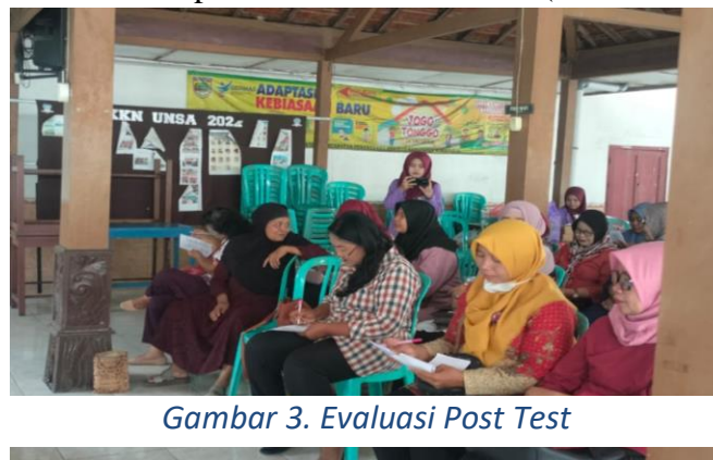
Gambar 3. Evaluasi Post Test