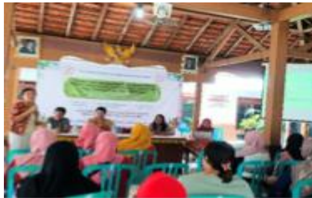
Gambar 2. Workshop Pembuatan Teh Sikers (Sirsak-Kersen)