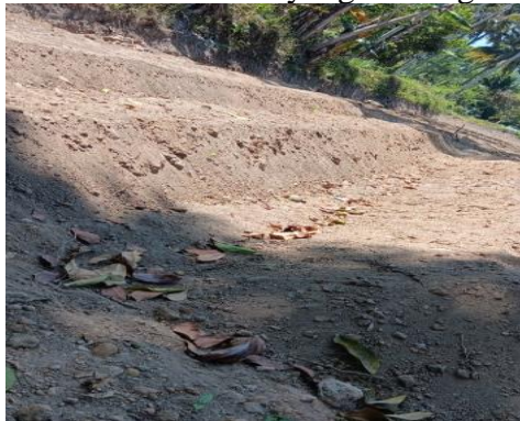
Gambar 1. Kondisi tanah bekas tanaman salak

Lahan bekas tanaman salak ini sebagian besar belum siap tanam karena masih banyak sisa - sisa akar tanaman dan batu - batu serta tanahnya kurang subur (gersang). Kondisi ini merupakan permasalahan yang harus segera diatasi. Masyarakat berharap dapat segera mengelola dan memanfaatkan lahan pekarangannya sehingga menjadi lebih produktif. Penambahan bahan organik merupakan salah satu solusi untuk meningkatkan kesuburan dan kesehatan tanah bekas salak tersebut, sehingga dapat digunakan sebagai media tanaman sayuran. Berikut ini adalah gambar kondisi tanah bekas tanaman salak yang masih gersang, belum ditanami apapun.