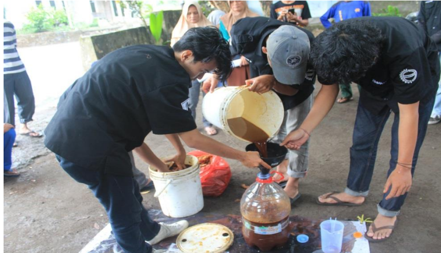
Gambar 3. MOL (Mikro Organisme Lokal ) yang terbuat dari gedebog pisang