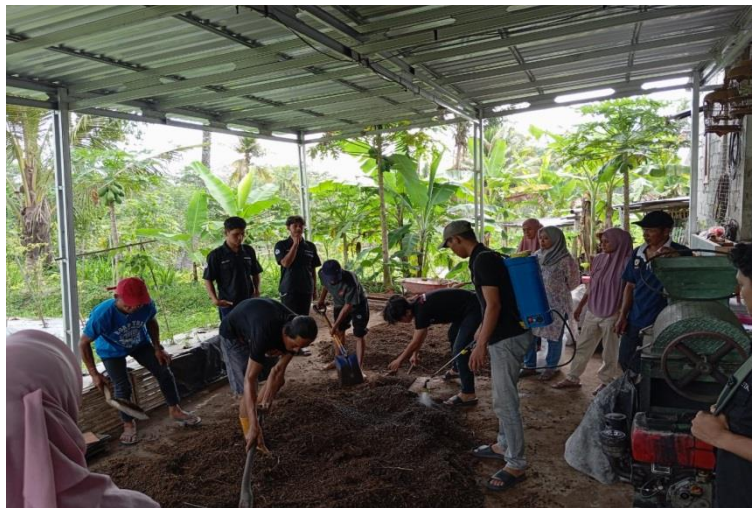
Gambar 4. Pupuk organik dari kotoran kambing dengan aktivator MOL buatan sendiri dari Gedebog pisang dan EM4 sebagai pembanding