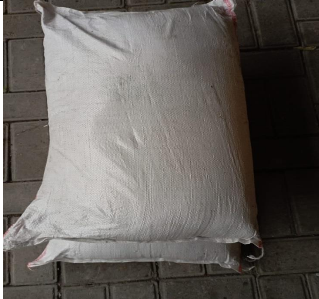
Gambar 5. Pupuk organik dari kotoran kambing yang sudah dikemas 25 kg

Tahapan pembuatan efektif mikrobia MOL dari gedebog pisang Kegiatan pelatihan efektif mikrobia dari gedebog pisang, dimulai dengan melakukan pencacahan gedebog pisang. Setelah gedebog dicacah dimasukkan ke dalam ember dan diberi air sampai penuh dan ditutup rapat. Cacahan gedebog selanjutnya direndam selama 10 hari sampai 15 hari atau selama 2 minggu, kemudian debog diperas, disaring, diberi air rebusan terasi, tetes dan ditaburi ragi tape, kemudian diaduk rata dan ditutup rapat serta dibiarkan selama 2 minggu. Selanjutnya perawatan pembuatan Efektif Mikrobia dilakukan dengan cara dibuka tutupnya agar oksigen masuk ke dalam larutan debog dan dilakukan pengadukan secara rutin setiap 3 hari sekali. Perubahan fisik yang terjadi selama fermentasi yaitu terbentuk buih, seperti terlihat pada Gambar 6.