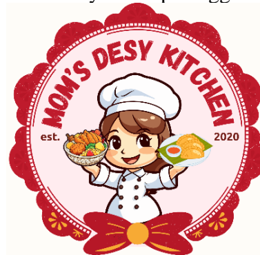
Gambar 4. Pembuatan Logo UMKM Mom's Desy Kitchen

Tahap ini adalah tahap pembuatan desain logo dan banner UMKM Mom's Desy Kitchen yang menggunakan aplikasi desain Canva. Di dalam logo terdapat elemen cireng isi dan rice bowl yang merupakan produk makanan yang dijual di UMKM Mom's Desy Kitchen. Untuk warna logo dipilih warna merah berdasarkan request dari Ibu Desy. Warna merah sendiri memiliki arti keberanian dan kekuatan yang diharapkan dapat mencerminkan tekad dan keinginan untuk tumbuh dan berkembang meski dihadapkan dengan tantangan. Sedangkan warna pink dapat memberikan kesan yang cerah, positif, dan optimis. Warna ini sering digunakan untuk menciptakan suasana yang menyenangkan dan menyambut pelanggan dengan kehangatan.