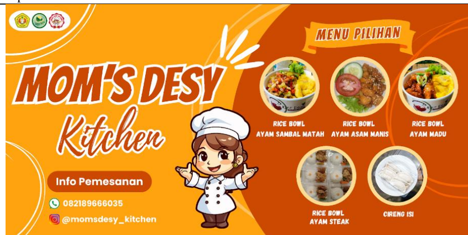
Gambar 5. Pembuatan Banner UMKM Mom's Desy Kitchen