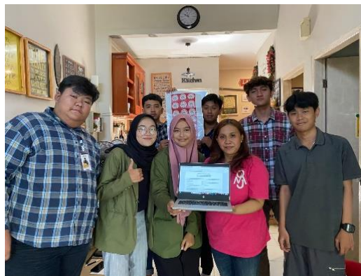
Gambar 6. Penyerahan Logo UMKM Mom's Desy Kitchen

Setelah melakukan desain logo dan banner kemudian dicetak, dilakukan penyerahan logo dan banner tersebut kepada pelaku UMKM Mom's Desy Kitchen. Dengan harapan agar dapat bermanfaat untuk menunjang kebutuhan usaha. Penyerahan hasil capaian dilakukan sebagai upaya dalam memberikan solusi mengenai kurangnya kesadaran merek UMKM Mom's Desy Kitchen. Untuk menciptakan citra merek, pelaku UMKM perlu memahami kebutuhan pelanggan, menciptakan kesan yang baik, dan membangun hubungan emosional dengan pelanggan. Hal ini diharapkan dapat membantu dan memberi kemudahan pada pelaku UMKM dalam menjalankan usahanya sehingga potensi yang dimiliki oleh UMKM Mom's Desy Kitchen dapat berjalan secara optimal.