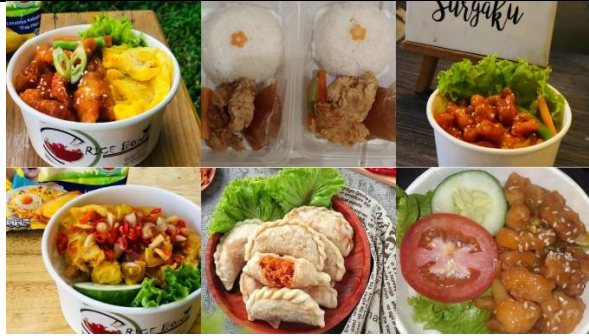
Gambar 3. Foto Produk UMKM Mom's Desy Kitchen