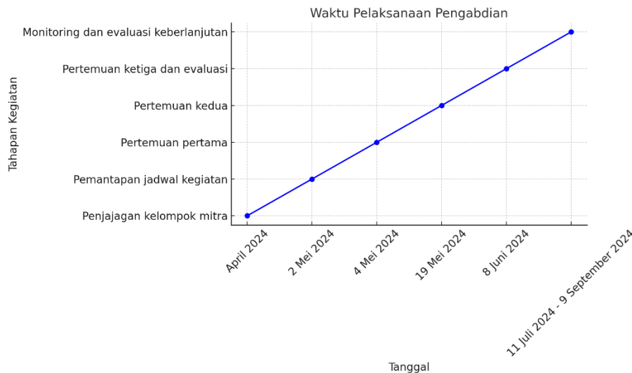
Gambar 2. Waktu Pelaksanaan Pengabdian Masyarakat

Pelaksanaan kegiatan berlangsung selama delapan bulan, mulai dari Maret 2024 hingga November 2024, dengan tahapan yang meliputi persiapan, pelaksanaan, monitoring dan evaluasi pelaksanaan, serta monitoring dan evaluasi pencapaian luaran dan target. Kegiatan ini bertujuan memastikan keberlanjutan implementasi hasil pengabdian melalui edukasi holistik menyusui, yang dirancang untuk meningkatkan pengetahuan dan keterampilan kader posyandu dalam mendukung pemberian ASI eksklusif.