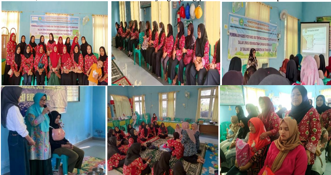
Gambar 3. Rangkaian kegiatan pengabdian pelatihan teori dan praktik edukasi holistik

Kegiatan pengabdian masyarakat dengan skema program pembinaan desa mitra ini berhasil mencapai hasil yang sesuai dengan luaran dan target yang direncanakan. Pada aspek input, kegiatan didukung oleh pelaksana yang kompeten sesuai kebutuhan program, ketersediaan dana pelaksanaan, serta terjalinnya kerja sama formal melalui MoU dalam rangka mendukung Tri Dharma Perguruan Tinggi. Selain itu, dukungan mitra juga diperoleh dengan bukti surat pernyataan dari pihak terkait, dan metode pelaksanaan menggunakan pendekatan holistik untuk