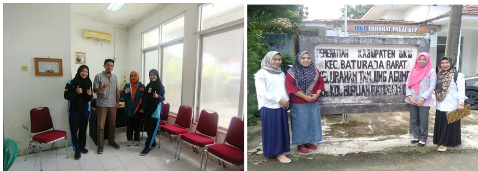
Bersama Lurah, Sekretaris dan staff kelurahan Tanjung Agung pada administrasi dan perizinan