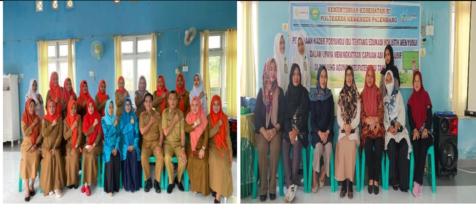
Penyamaan persepsi kegiatan pengabdian bersama Kepala Puskesmas Tanjung Agung dan bidan sebagai team monev keberlanjutan kegiatan pengabdian