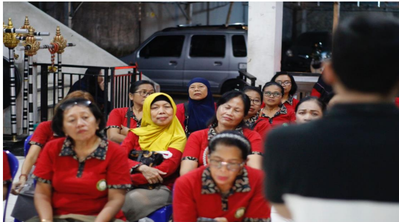
Gambar 3. Pemaparan Materi oleh Narasumber