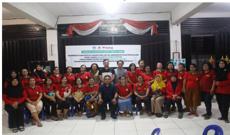
Gambar 5. Peserta Pengabdian Kepada Masyarakat Pemula Agro Pertiwi