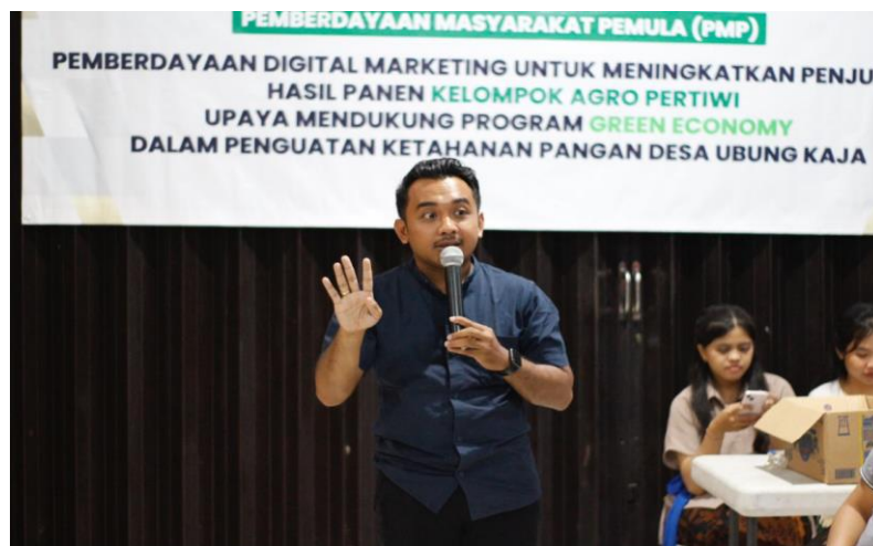
Gambar 4. Sesi Diskusi dengan Narasumber