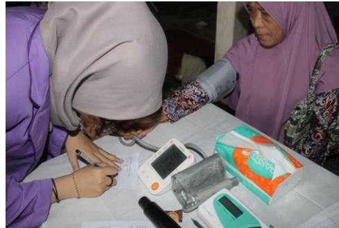
Gambar 1. Medical Check Up

Menurut (Whelton et al. , 2017) tekanan darah memiliki 4 kategori yang dilihat dari hasil pengukuran tekanan darah sistolik dan diastolik yaitu tekanan darah dengan nilai normal, nilai tinggi, hipertensi stage 1, dan hipertensi stage 2. Tekanan darah yang masuk dalam kategori normal adalah <120 mmHg/ 80 mmHg. Kategori tinggi dengan nilai 120-129 mmHg/ <80 mmHg. Kategori hipertensi stage 1 dengan nilai 130-139 mmHg/ 80-89 mmHg. Kategori hipertensi stage 2 dengan nilai \geq 140 mmHg/ \geq 90 mmHg. Hasil dari pengecekan tensi dapat dilihat pada gambar grafik 1 ada sekitar 57,14% peserta yang datang memiliki tensi dengan nilai di atas kategori tekanan darah normal (hipertensi).