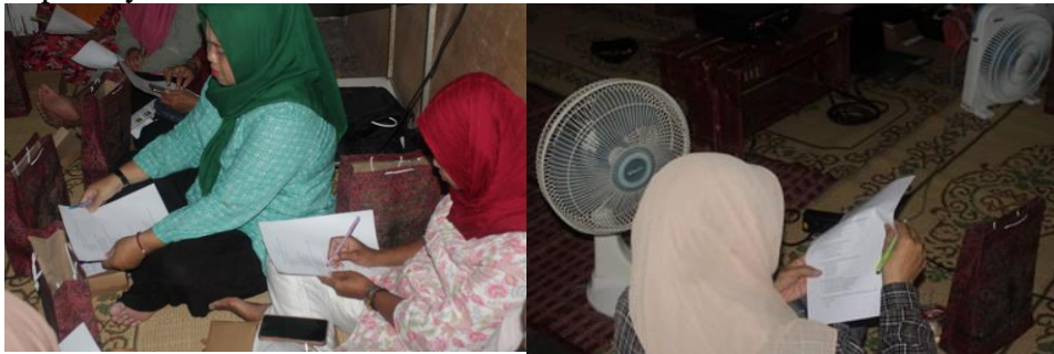
Gambar 3. Kegiatan pre-test dan post-test

Kegiatan pembuatan jamu saintifik hipertensi dan kebugaran tubuh dilakukan bersama oleh masyarakat Desa Gajahan, dengan kegiatan ini memiliki manfaat memberikan pendidikan kepada masyarakat tentang manfaat dan cara penggunaan jamu saintifik untuk mengelola hipertensi dan meningkatkan kebugaran tubuh. Pada saat workshop pembuatan jamu saintifik dijelaskan komponen simplisia dalam jamu hipertensi dan kebugaran tubuh, langkah-langkah pembuatan jamu, penggunaan wadah yang tepat merebus jamu serta cara konsumsi jamu. Kegiatan pre-test untuk menilai kondisi awal pemahaman dan kesiapan para peserta terkait jamu saintifik hipertensi dan kebugaran tubuh. Pada kegiatan post-test bertujuan untuk mengevaluasi sejauh mana dampak dan efektivitas kegiatan pengabdian tersebut terhadap masyarakat.