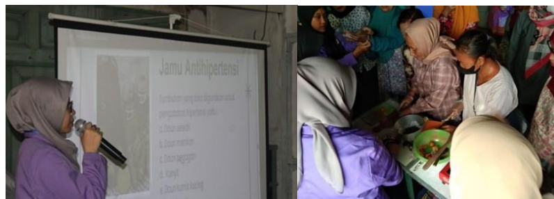
Gambar 2. Kegiatan pemaparan materi dan pembuatan jamu saintifik

Kegiatan dilanjutkan dengan pemaparan materi yang sangat relevan dan bermanfaat bagi masyarakat, terutama dalam konteks kesehatan terkait hipertensi, jamu saintifik, dan jamu kebugaran tubuh. Hipertensi termasuk ke dalam suatu penyakit yang banyak diderita oleh