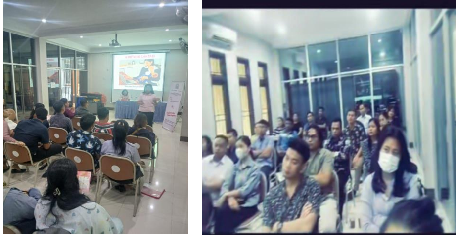
Gambar 2. Tanya Jawab tentang Pengetahuan Kesehatan Reproduksi dengan Calon Pengantin

Calon Pengantin di Paroki Santa Maria Ratu Rosari Tanjung Selamat. Fenomena bahwa sebenarnya calon pengantin belum pernah tahu sebelumnya tentang pemeriksaan kesehatan yang harusnya dilakukan oleh sepasang calon pengantin, yang diketahui hanyalah suntik TT sebelum menikah akan tetapi belum tau mengapa harus melakukan suntik TT. Calon pengantin wanita juga belum tau bagaimana cara menghitung masa subur. Para calon pengantin menyatakan mengerti akan pentingnya kesehatan reproduksi dalam persiapan kehamilan, persalinan, Nifas dan Perawatan Bayi Baru Lahir.