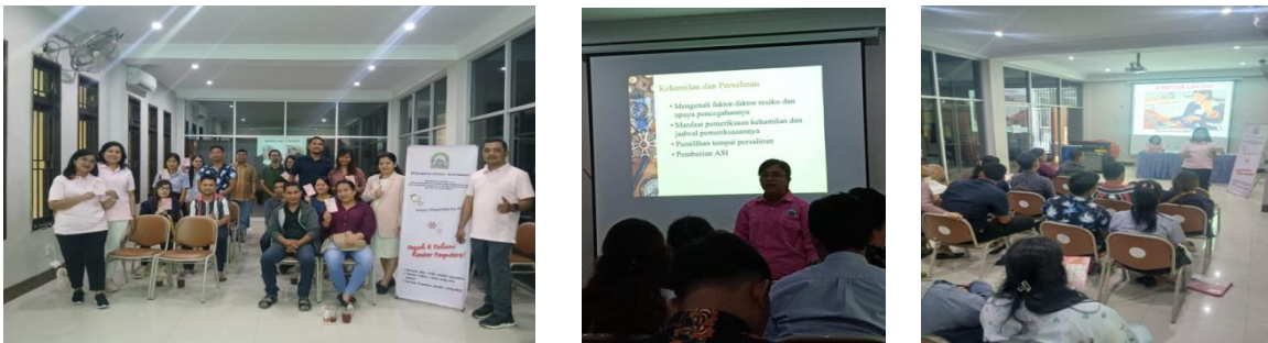
Gambar 2. Pelaksanaan Kegiatan Implementasi KePOin Aja Biar SMART

Tahap Pelaksanaan. Kegiatan dilaksanakan selama 4 kali pertemuan dengan calon pengantin pada tanggal 4 Mei 2024, 8 Juni 2024, 6 Juli 2024 dan 10 Agustus 2024. Dengan jumlah calon pengantin 22 Pasang. Edukasi dilaksanakan melalui media Banner, Kartu Sakera (Kartu Sadar Kanker Payudara) dan website Kepoin aja. Pasangan calon pengantin diberi kesempatan untuk membuka website kepo in aja dan diajari cara penggunaannya, mulai dari cara mengisi skor risiko kanker payudara sampai dengan memanfaatkan materi dalam website tersebut.