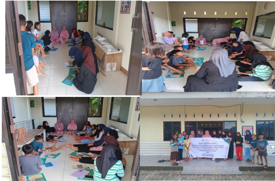
Gambar 2 Tahap Pelaksanaan dan Evaluasi Kegiatan

Tahapan terakhir dilakukan evaluasi secara kualitatif dengan wawancara dan memberikan sepuluh soal post test setelah melakukan kegiatan. Dari hasil tanya jawab kepada remaja dalam kegiatan pengabdian Masyarakat ini, semuanya menjawab sangat antusias dan senang mereka juga menyampaikan bahwa semua memiliki cita-cita yang tinggi dan berharap semoga dapat terwujud, kutipan pernyataan mereka: