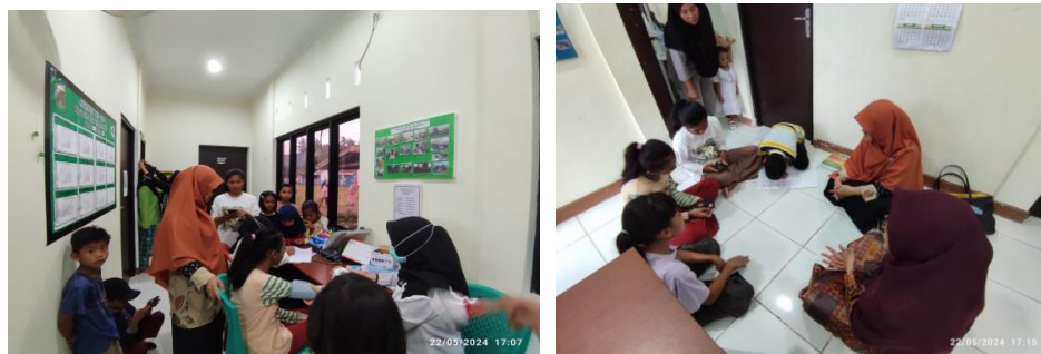
Gambar 1 Tahap Identifikasi Masalah