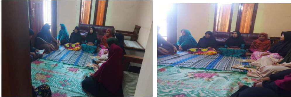
Gambar. 3 Evaluasi Kelas spiritual

Metode kegiatan dalam penerapan Pengabdian masyarakat pengenalan menjelang masa menopause melalui edukasi berbasis masyarakat tentang mengatasi kecemasan dengan metode zikir di Arisan Perum Griya Tegal Sari Indah Jl. Seruni Blok D1 Desa Ledug, Kecamatan Kembaran. Strategi dan yang di gunakan adalah: