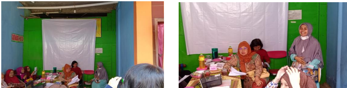
Gambar 1. pemberian lembar pre test dan materi dzikir

Berikut ini hasil dari kegiatan yang dilaksanakan di Desa Leduk Kecamatan Kembaran