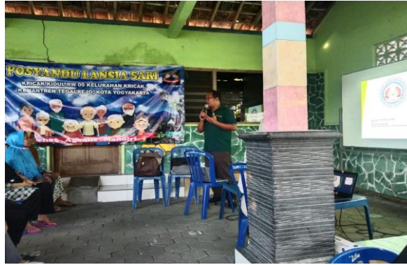
Gambar 3. Penjelasan tentang Senam Otak