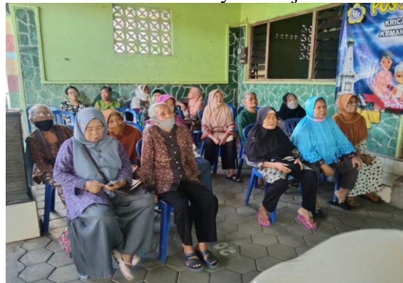
Gambar 2. Peserta PKM Posyandu Lansia “Sari”