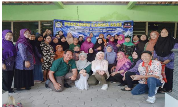
Gambar 5 Peserta PKM setelah selesai senam otak