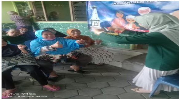
Gambar 4. Simulasi senam otak oleh tim PKM