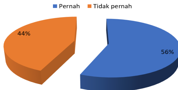
Gambar 1. Riwayat Skabies Peserta

Hasil yang telah didapatkan dari kegiatan ini yaitu telah diberikannya edukasi kesehatan kepada 16 orang santri yang tergabung dalam kader SIGAB di Pondok Modern Al-Kautsar Pekanbaru. Kegiatan berjalan dengan lancar dan tidak ada peserta yang keluar masuk selama kegiatan berlangsung. Secara lengkap hasil pelaksanaan disajikan pada gambar dan grafik berikut.