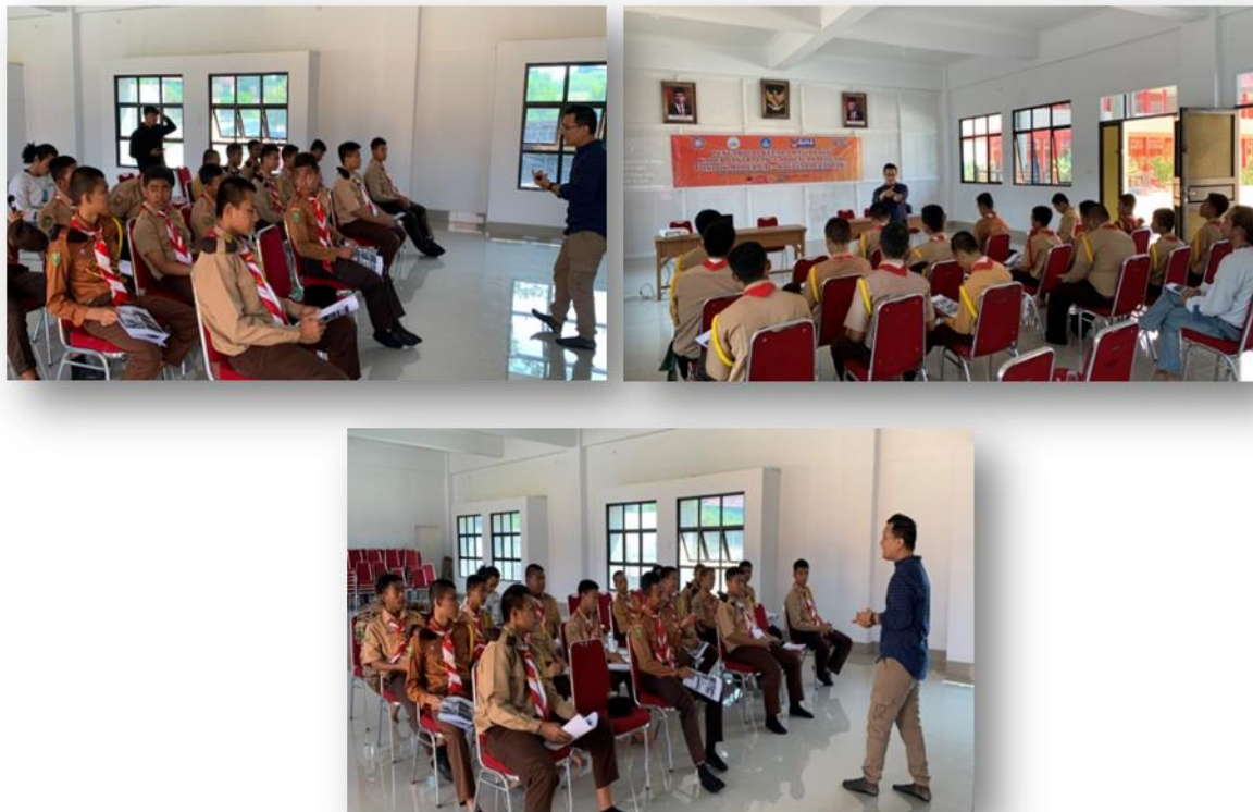
Gambar 2. Pemberian Edukasi Kepada Peserta Kegiatan

Penelitian yang dilakukan oleh Lizamani, Rahman, dan Kholisotin di Pondok Pesantren Roudlotun Tholibin juga menyebutkan adanya pengaruh pemberian edukasi terhadap perilaku pencegahan skabies oleh santri. Pemberian edukasi terkait personal hygiene dan sanitasi lingkungan memberikan dampak yang positif terhadap peningkatan pengetahuan santri akan pentingnya menjaga kebersihan diri dan lingkungan (Lizamani et al., 2021). Dengan demikian, pemberian edukasi kepada santri menjadi salah satu faktor penting dalam membentuk perilaku dan kesadaran akan hidup bersih dan sehat di lingkungan pesantren yang dapat berpengaruh terhadap kejadian skabies dan penyakit yang berkaitan dengan personal hygiene lainnya. Selama pelaksanaan kegiatan, peserta antusias, aktif bertanya, dan memperhatikan materi yang diberikan. Sebagian peserta merasa hal ini sangat penting disampaikan kepada seluruh santri mengingat masih banyaknya santri yang kurang memperhatikan perilaku-perilaku yang berisiko menularkan skabies. Adanya bentuk sikap positif dan antusiasme dari seluruh peserta yang hadir dapat menjadi motivasi yang mendorong perubahan perilaku dan sikap yang lebih memperhatikan personal hygiene dan kebersihan lingkungan.