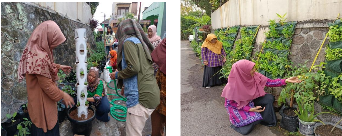
Gambar 3. Penanaman tanaman di lorong sayur dan kondisi lorong sayur

Hasil dari tanaman di lorong sayur ini sudah bisa dipetik hasilnya, seperti tomat, daun bawang, bayam dan seledri. Minat kelompok tani dan warga semakin meningkat untuk kembali bercocok tanam menanam sayuran di lorong sayur. Hasilnya bisa dikonsumsi oleh anggota kelompok tani dan juga dibeli oleh warga di sekitar lorong sayur. Masyarakat terutama kelompok tani RW 03 Winong Kelurahan Prenggan Kemantren Kotagede dapat menikmati hasil dari kegiatan pemberdayaan masyarakat ini, dan harapannya baik kelompok tani maupun masyarakat bisa terus melanjutkan kegiatan ini secara mandiri. Pelatihan pengolahan sayuran menjadi makanan yang bergizi merupakan kegiatan pengabdian yang kedua. Hasil dari tanaman di lorong sayur dimanfaatkan untuk dikonsumsi oleh masyarakat baik anggota kelompok tani maupun warga sekitar lorong sayur. Selain itu hasil tanaman dari lorong sayur juga diolah menjadi makanan yang bergizi yang dapat menambah cita rasa dari sayuran tersebut. Olahan dari sayuran ini adalah berupa cake bayam wortel (cabatel), cookies bayam wortel (cobatel), cookies sawi wortel (cosatel), stik bayam, rolade tahu bayam, terong krispi dan rempeyek bayam.