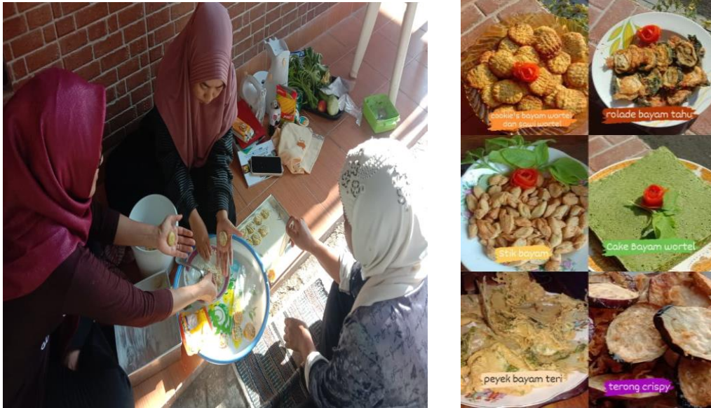
Gambar 4. Pengolahan sayuran menjadi makanan yang bergizi

Dengan pengolahan sayuran menjadi makanan yang lebih bervariasi ini dapat meningkatkan pengetahuan dan keterampilan dari peserta. Peserta kemudian mempunyai ide-ide inovasi yang kreatif dalam pengolahan sayuran. Selain dapat dikonsumsi untuk tingkat rumah tangga, produk hasil olahan sayuran ini bisa dijual dan dapat menambah pendapatan kelompok tani atau keluarga. Hal ini sesuai dengan penelitian bahwa program Lorong Garden memberikan adanya manfaat ekonomi nyata yang meningkat bagi masyarakat seiring dengan waktu (Razak Munir et al. , 2017). Pertanian di daerah perkotaan dapat memberikan dampak terhadap perekonomian masyarakat. Kelompok tani yang dilibatkan dalam kegiatan ini dapat mengembangkan dengan program-program yang inovatif sehingga dapat meningkatkan kreatifitas dan hasil dari lorong sayur. Hasil dari lorong sayur dapat dikembangkan sehingga dapat menambah perekonomian masyarakat kelompok tani khususnya dan masyarakat sekitar pada umumnya. Berdasarkan teori hasil analisis dari Leverage ditemukan terdapat empat atribut sebagai faktor sensitif yang mempunyai pengaruh terhadap tingkat keberlanjutan pada dimensi ekonomi, yaitu (1) peran serta yang aktif dari badan usaha lorong, (2) kebutuhan modal, (3) tingkat kelayakan usaha tani, dan (4) kontribusi produk Lorong Garden untuk mensubstitusi terhadap kebutuhan atau pemenuhan pangan dan gizi keluarga (Wisneni, Abdullah and Boceng, 2021).