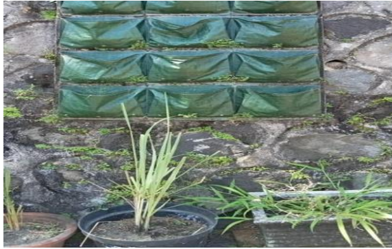
Gambar 1. Kondisi lorong sayur sebelum dilakukan kegiatan

Berdasarkan gambar 1 tersebut terlihat bahwa kondisi lorong sayur pada saat sebelum dilakukan kegiatan pengabdian adalah tidak terawat dengan baik sehingga tanaman sayuran juga tidak subur. Kegiatan pengabdian kepada masyarakat dengan melakukan pemberdayaan kepada masyarakat terutama kelompok tani RW 03 ini diharapkan bisa mengoptimalkan warga terutama kelompok tani untuk mencintai tanaman serta menyadari akan pentingnya memanfaatkan pekarangan di lahan sempit untuk gerakan menanam sayur sehingga lahan sempit tersebut menjadi lahan yang produktif dan memberikan manfaat bagi warga sekitarnya. Di samping itu juga untuk memenuhi kebutuhan keluarga akan sayuran sebagai sumber makanan yang bergizi serta menjadi salah satu media untuk mengajarkan pada anak-anak sejak dini untuk gemar menanam dan makan sayur. Selain itu juga dapat dimanfaatkan untuk menambah penghasilan keluarga. Setiap orang membutuhkan konsumsi sayur mayur untuk pemenuhan gizi harian sehingga peluang untuk memasarkan hasil panen akan menjadi lebih luas dan mudah jika dilakukan dengan metode yang benar. Hal ini diharapkan dapat menambah peningkatan ekonomi pada keluarga maupun kelompok tani jika hasil panen bisa dioptimalkan. Harapan dari tim pengabdian adalah dengan semakin banyak yang menanam sayur di setiap rumah dan terlaksana secara berkelanjutan, dan adanya kelompok tani di wilayah RW 03 ini dapat menjadi percontohan bagi wilayah lain.