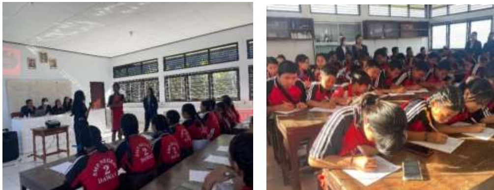
Gambar 2. (a) Pelaksanaan Edukasi, (b) Pengisian Pre-Test

Kegiatan kemudian diakhiri dengan pengisian post-test yang terdiri dari 17 butir pertanyaan yang sama dengan pre-test. Kegiatan ini dilakukan dengan tujuan untuk menilai peningkatan pemahaman remaja terkait dengan bullying dan harapannya dengan meningkatnya pemahaman tentu secara tidak langsung dapat menurunkan angka kasus bullying khususnya di Desa Gunaksa.