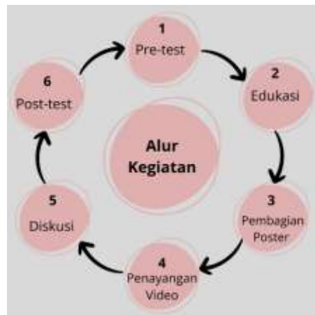
Gambar 1. Alur Kegiatan Pelaksanaan Edukasi Mengenai Bullying Pada Remaja

Kegiatan pengabdian masyarakat ini dilaksanakan di Sekolah Menengah Pertama (SMP) Negeri 2 Dawan pada tanggal 19 Agustus 2023 pukul 09.00 WITA dengan melibatkan sebanyak 50 remaja SMP yang berada pada lingkungan Desa Gunaksa. Metode pelaksanaan kegiatan terdiri dari beberapa rangkaian meliputi pengisian pre-test dan post-test, pemberian edukasi, pembagian poster, penayangan video, diskusi interaktif, dan pembagian poster. Kegiatan diawali dengan pengisian pre-test yang terdiri dari 17 butir pertanyaan mengenai materi seputar bullying . Kemudian dilanjutkan dengan sesi pemaparan materi yang disampaikan dengan menggunakan slide berupa power point . Edukasi diberikan dalam 3 sesi yaitu sesi pemaparan materi, penayangan video, dan diskusi. Pada sesi 1 dilakukan pemaparan materi tentang bullying yang disampaikan oleh 3 pemateri yang merupakan Tim PPK Ormawa mengenai pengertian bullying , jenis-jenis bullying , ciri-ciri korban atau pelaku bullying , dampak bullying , hingga alur pelaporan bullying . Ditengah-tengah kegiatan edukasi, remaja juga diberikan poster yang telah di buat oleh Tim PPK Ormawa berisikan materi mengenai bullying . Pada sesi 2 dilakukan penayangan video tentang bullying selama 3-4 menit. Kemudian pada sesi 3 dilakukan diskusi terkait materi sesi 1 dan 2 dimana remaja aktif bercerita dan diskusi tentang pengalaman mereka ataupun teman disekitar mereka yang pernah mengalami bullying .